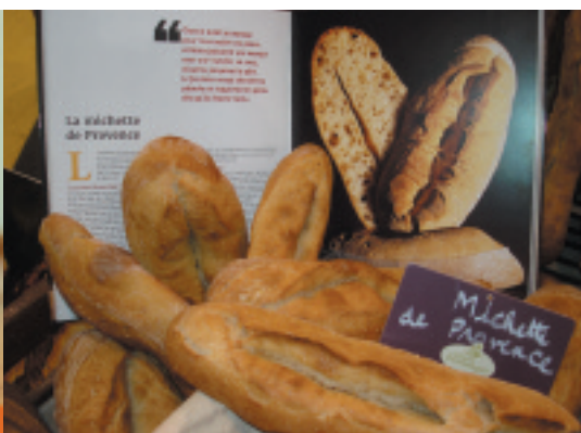
Deux des pains régionaux en vedette