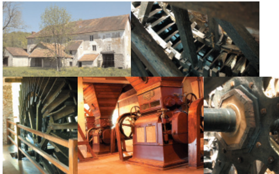
le vieux moulin et la fameuse grande roue. Vaut le voyage !