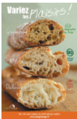
le kit 3 baguettes