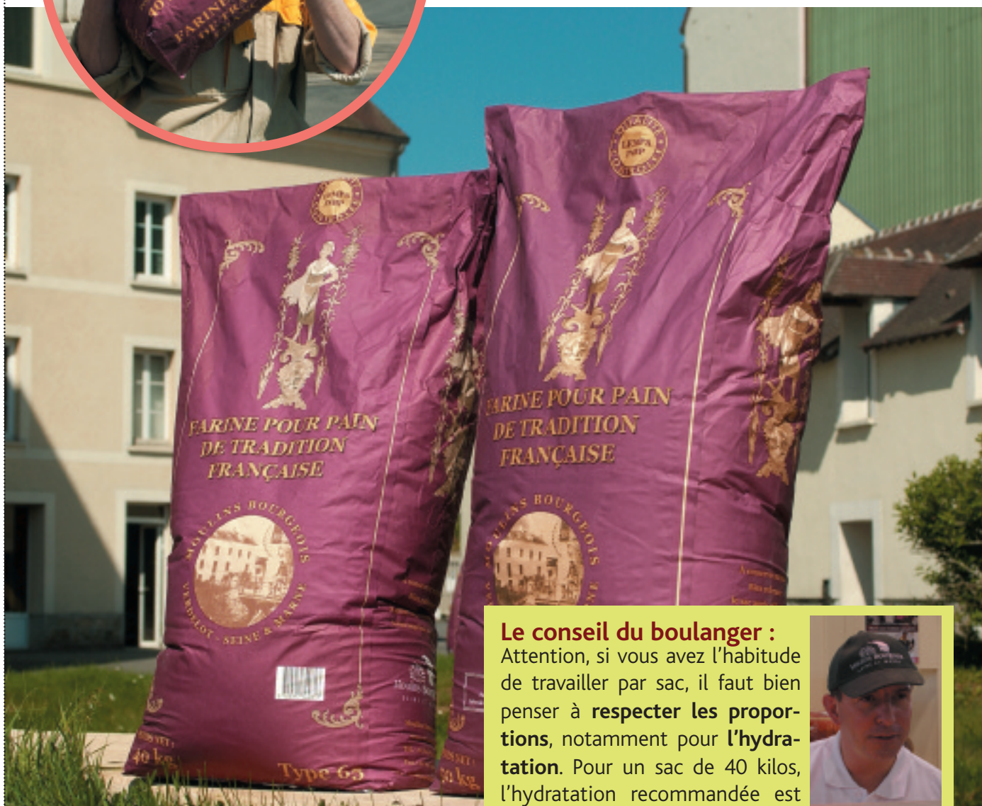
40 et 50 kilos: une différence visible